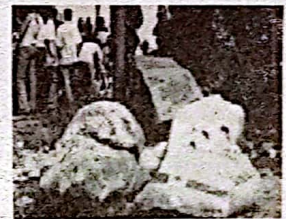
Tres Puertas (Piedra Gorda)