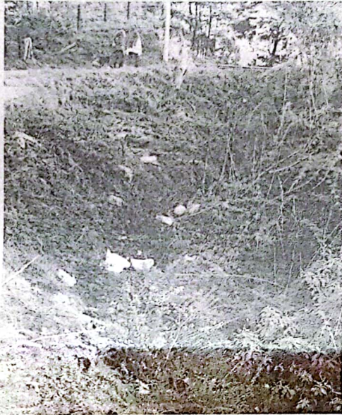
Curva Fea (Vereda el Plan)