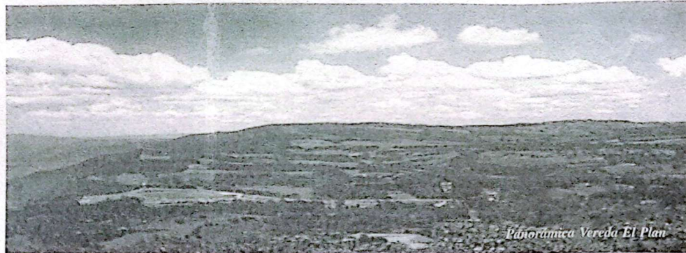
Páramo Vereda El Plan

Para el caso específico del parque Arví, su importancia como atractivo turístico cobra vigencia por la nueva resignificación y valoración social que se hace de una serie de recursos inmersos en dicho ecosistema, lo que reafirma la necesidad de su disfrute en forma racional, bajo la nueva modalidad de turismo ecológico que se impone para