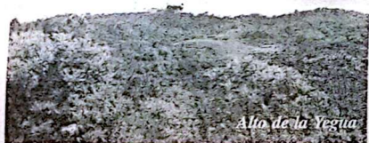
Alto de la Yegua

Como eje central y estructurante del potencial eco - cultural para el desarrollo del turismo en el Parque, está su población actual y su acervo cultural, representado en sus costumbres, creencias, actividades productivas y formas de ocupación del territorio. Se destaca la tradición en el cultivo de flores, la cual se ha constituido en la imagen de Antioquia y Colombia en el exterior. Además, tiene asiento una muestra