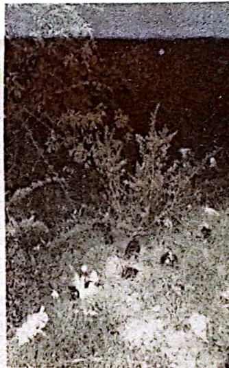
Entrada al Bosque, falda de Don Eladio(Vereda Barro Blanco)