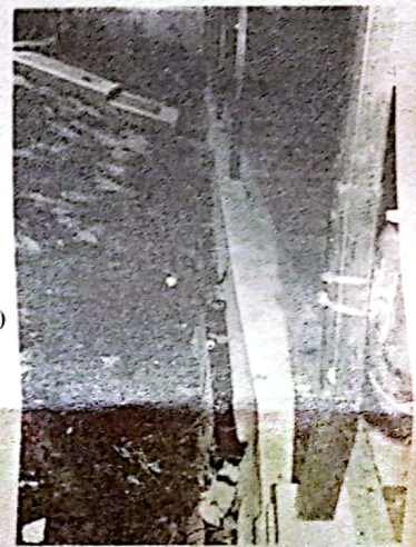
Cuneta de 8C Liceo Santa Elena