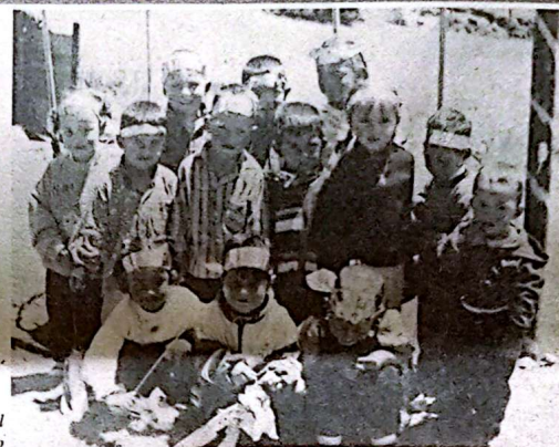
Algunos Niños del Hogar en San Ignacio