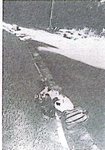
Recta de los Roldan (Vereda el Plan)