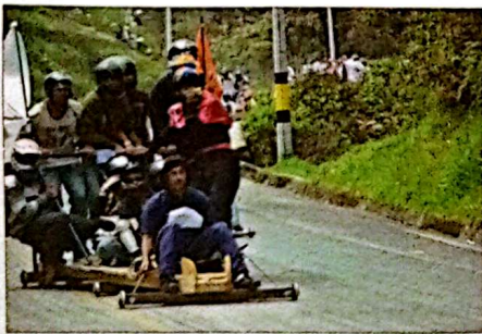
Ojo en la curva pues, parecen pensar los que van atrás, haciéndole fuerza al carro para no caer. Y es que los de atrás son realmente los estrategas de las maniobras para bajar sin caídas a la meta.