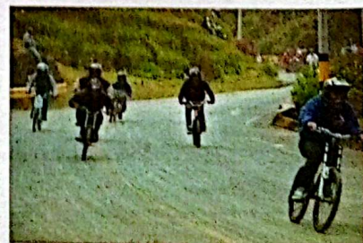
Y con vía cerrada, qué maravilla, aprovecharon varios ciclistas para bajar en los intervalos entre carros de rodillos. Aquí, uná tanda grande.