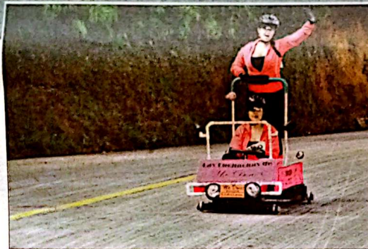
Muchas chicas este año, varios carros comandados por mujeres, como este de la foto y muchas jóvenes "camufladas" en carros repletos de hombres.