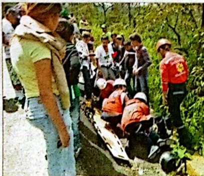
Un accidente, todavía muy arriba y muchas dificultades para solicitar ayuda. Un sector de la carretera donde no hay señal de ningún operador de celular. Hubo forma de ubicar organismos de socorro a través de un radio de la Red de Cooperantes de Santa Elena. Tampoco había ambulancias escalonadas para atender accidentes en diferentes sectores. En esta zona no había ni una y la que llegó se demoró 15 minutos para arribar al lugar. Los chicos de este carro cayeron al abismo y los atajó la maleza, uno de ellos se encontraba mal, los demás ilesos.