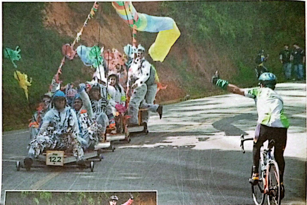
Al comienzo, hasta hubo tiempo de saludar a los primeros que arrancaron.