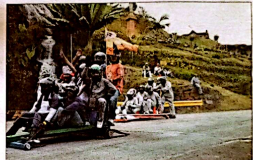
Y fue un buen "parche". Las familias se apostaron a lado y lado para ver la creatividad de los participantes.