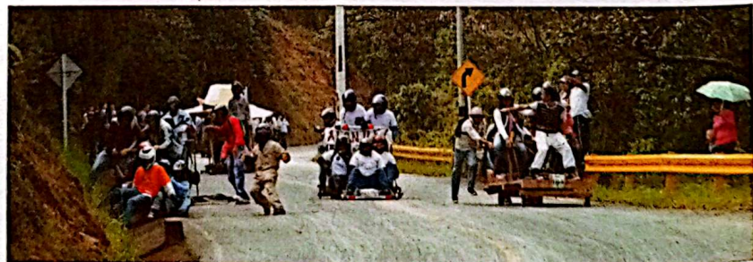
Ay Jue madre, ve, se cayeron. Estos, por fortuna sin consecuencias y se pararon, voltiaron el carro, se acomodaron otra vez y arrancaron pa' abajo otra vez.